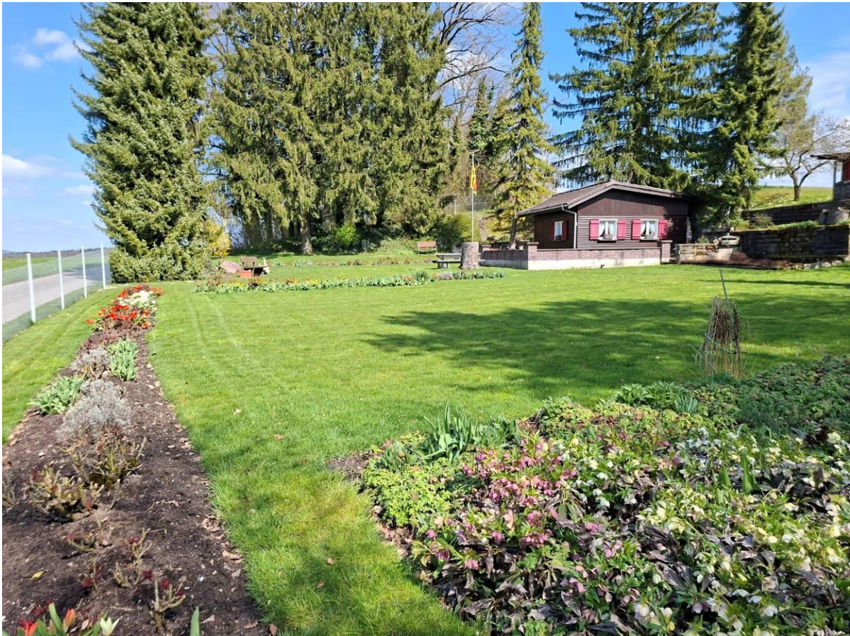
Idyllischer Garten mit viel Platz für Freizeit und Erholung

Rund 1'310 m 2 dienen als Umschwung für Garten und Freizeit. Die Gesamtfläche des Grundstückes beträgt 1'369 m 2 .