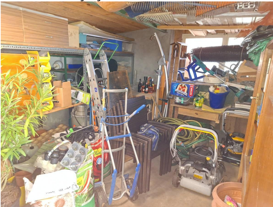
Abstell- und Lagerraum