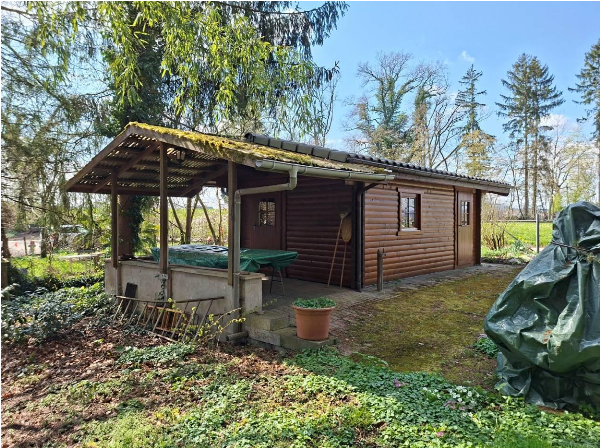
Gartenhaus mit Vorplatz und Autoparkplatz