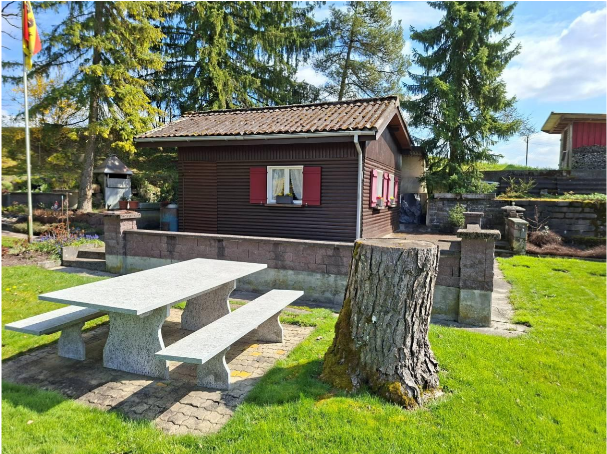
Gartenhaus mit Umschwung für Freizeit und Erholung