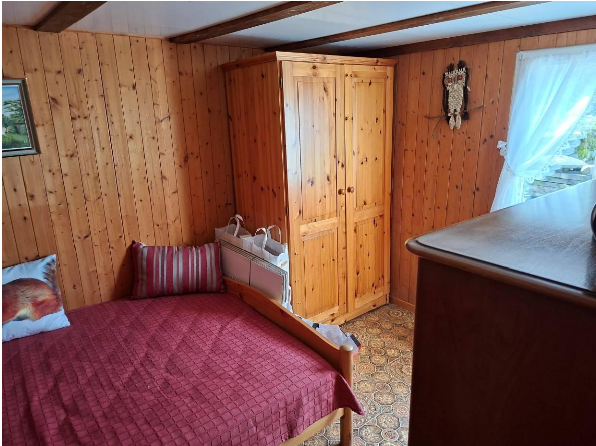
Zimmer mit Übernachtungsmöglichkeit