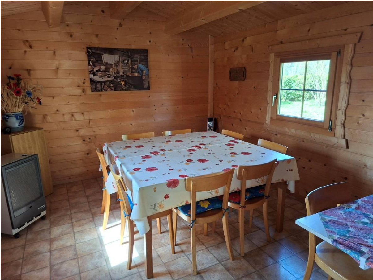
Aufenthaltsraum im Gartenhaus Vers.-Nr. 2039 ohne feste Einrichtungen, Wasser- und Stromversorgung