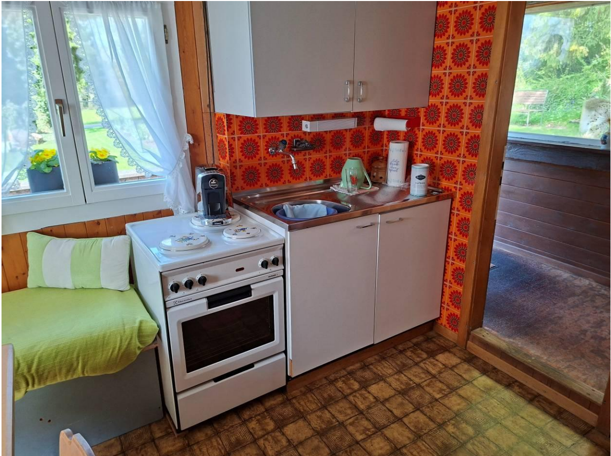
Kochnische und Aufenthaltsraum