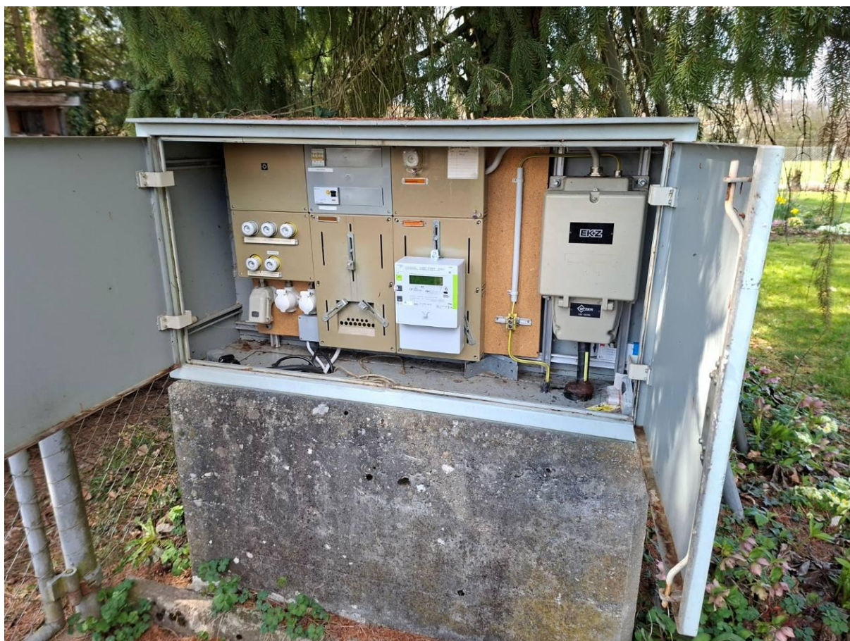
Stromversorgungskasten für die beiden Grundstücke